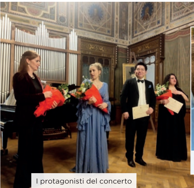
I protagonisti del concerto