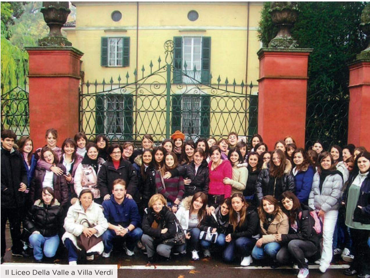
Il Liceo Della Valle a Villa Verdi

Dedicai molta attenzione alla didattica poiché i vecchi direttori di conservatorio ammettevano solo l'insegnamento basato sulla lettura della musica e non anche sull'ascolto e sulla riproduzione ad orecchio. Da allora frequentai il Centro di Animazione Multimediale a Lecco del M° Di Benedetto (dove conobbi il M° Carlo Delfrati) che mi aprì un mondo verso le varie forme di comunicazione musicale e di progettazione per l'avvio della trasformazione degli istituti musicali in licei musicali e coreutici e coprire quindi il vuoto tra la scuola primaria e secondaria e il conservatorio. Tutta questa esperienza mi permise di ini-