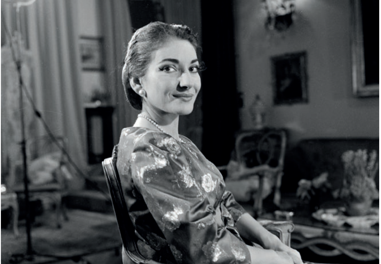
Maria Callas posa per il talk show Small Word di Edward R. Murrow, nel 1958

Il 1958, 2 gennaio, iniziò con l'increscioso caso al Teatro dell'Opera di Roma: Maria Callas al termine del primo atto della Norma dichiarò forfait , causa un' improvvisa afonia ... Era la serata di gala, presente il presidente della Repubblica Giovanni Gronchi. La cantante gli invierà una solenne lettera di scuse. Si venne a sapere che la notte di Capodanno l'aveva trascorsa piuttosto "distrattamente".