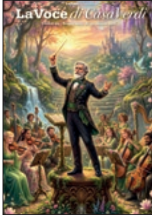
IN COPERTINA Immagine generata con intelligenza artificiale