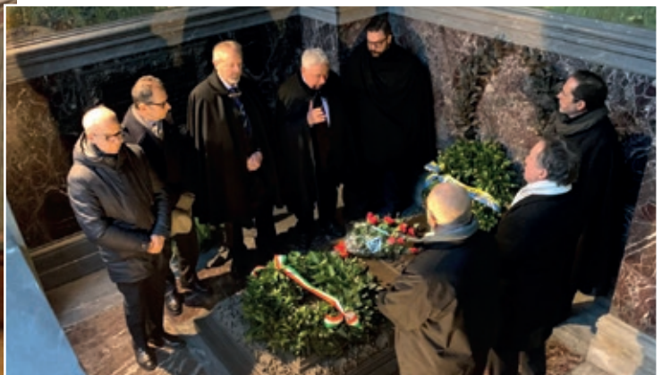
La delegazione del Club dei 27 di Parma che rende omaggio alla tomba di Verdi.